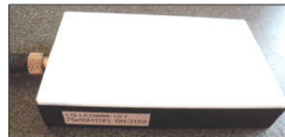
Abb. 2: Flächenlicht zur Durchlichtbeleuchtung bei SPECK Sensorsysteme (links); Beleuchtung im Einsatz am Funktionsprototypen (unten)